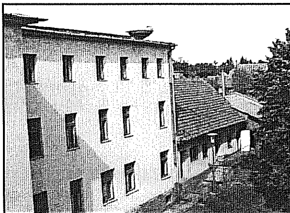
A volt internálótábor egyik irodaépülete

A tábor a vörös terror idején „kezdte meg működését”. Főként katonatiszteket és állami előjárókat hoztak Kistarcsára. A falakon belül semmiféle átnevelés nem zajlott, csak a rabok kínzása és verése történt.